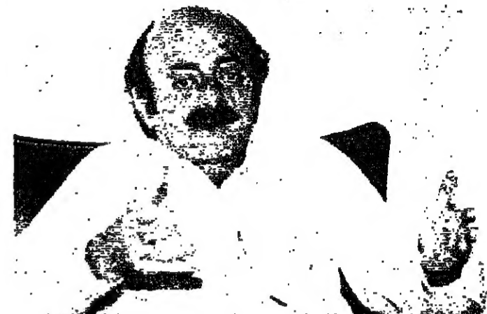
اربع الطائف يتصرفون بغيره

انني ازايدي احيانا بالتعاون مع سوريا لكن الحسيني والحصل ليسا مع سوريا اطلاقا ليغير الحصص الوزارة اذا كان يستطيع ... ولا شرف لي بان اكون معه في الحكومة